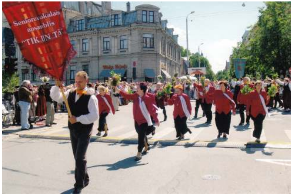
Senioru jauktais vok lais ansamblis "Tik un t" Dziesmu sv tku g jien .

J , probl mu netr kst, ta u El nai ar optimisma p rp r m, lai cer gi teiktu: "Es ticu, ka pamaz t m viss sak rtosies, un m su kult ras nams b s k sv tn ca visiem tiem, kuriem ir svar gas