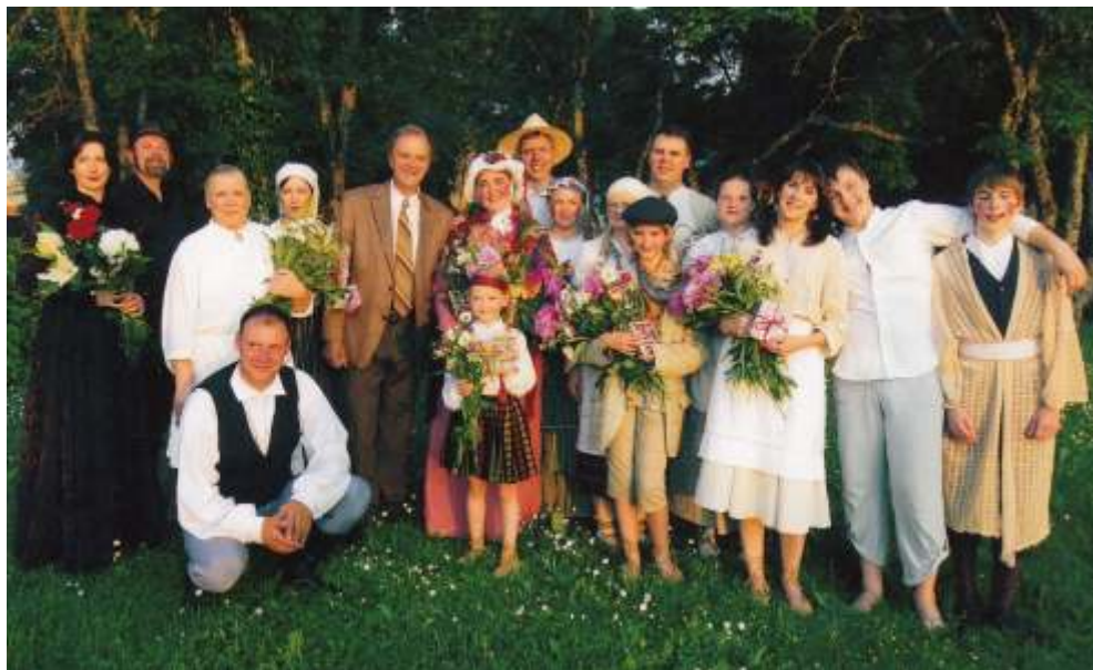
Amatierte trim – 60. P c R. Blauma a lugas "Tr nes gr ki" pirmizr des.

Madlienas kult ras nam viesojusies Inta K rkli a