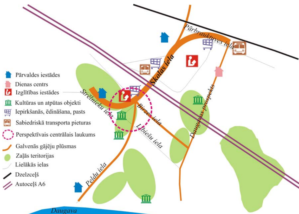
2. attēls: Ikšķiles centra perspektīvā struktūra

Apdzīvotība, gājēju un transporta plūsmas: Lai Ikšķiles pilsētas galvenais laukums būtu apdzīvots, tajā jānotiek dažādiem pasākumiem, un jābūt cilvēku plūsmai dažādās diennakts stundās. Lai veicinātu laukuma apdzīvotību, tajā nedrīkst būt automašīnu kustība. Tāpēc automašīnu kustība uz Domes ēku jānovirza pa Birzes ielu, izveidojot jaunu ielas posmu aiz skolas ēkas piebraukšanai pie novada Domes. Tāpat nepieciešams detalizēti izstrādāt un apsvērt iespēju savienot krustojumu starp Birzes, Skolas un Peldu ielas pagarinājumu, kā arī uzbrauktuvi un nobrauktuvi uz autoceļa A6 (aplis, izstiepts aplis). Perspektīvā varētu veidot divu līmeņu krustojumu Peldu ielai ar Lībiešu ielu, tādējādi papildinot pilsētas centra daļu ar jaunu vizuālu objektu. Automašīnu stāvvietu problemātiku varētu risināt, tās izvietojot pazemē zem Ikšķiles centrālā laukuma, izmantojot reljefa priekšrocības. Šāda risinājuma nepieciešamību nosaka apstākļi, ka laukuma tiešā tuvumā nav pietiekamu brīvu teritoriju autostāvvietu izvietojšanai. Lai arī dārgāks risinājums, tomēr tas ir sociālekonomiski