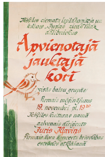
Plakāts ar aicinājumu uz kora mēģinājumu, 1980. gads.

Pēdējos piecos gados koris sniedzis gan solokontertus, gan piedalījies lielos skatuviskos uzvedumos. 2015. gadā – uzvedumā „Ulubeles pasakas”, 2016. gadā – uzvedumos „Čaks dzīvo” un „Teiksma par mīlestību”. 2017. gadā koris piedalījās starptautiskajā koru konkursā „Sudraba zvani”, kurā ieguva 2. pakāpes diplomu. 2018. gadā, piedaloties koru skatē pirms Vispārējiem dziesmu un deju svētkiem, koris tika no-