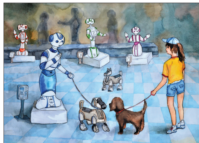
Līva Onckule, „Robotu izstāde”.

Neskatoties uz to, ka mākslas programmas audzēkņi no deviņiem mācību mēnešiem tikai pus-