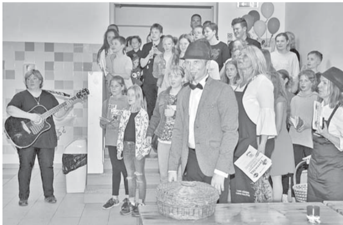
Muzeju nakts Ikšķiles vidusskolā.

19. maijā visā Latvijā notika Muzeju nakts pasākumi. Latvijas simtgadē Muzeju nakts tēma bija „Šūpulis”, savukārt 2018. gada vadmotīvs ir „Dzimšana”.