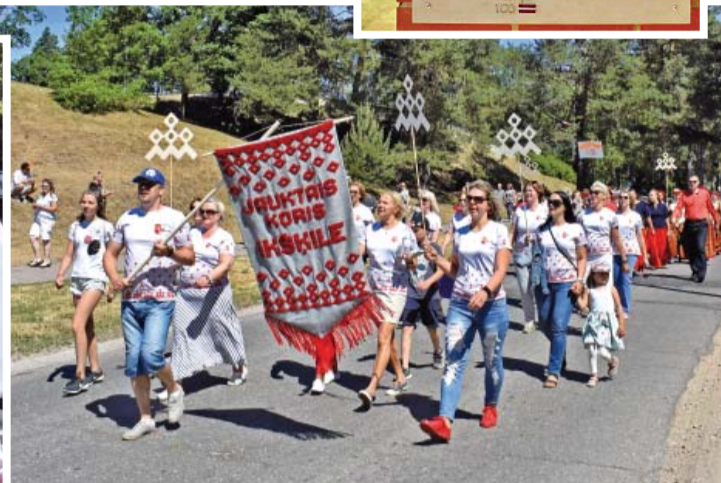
Jauktais koris „Ikšķile” priecēja gan svētku koncertā, gan gājienā.