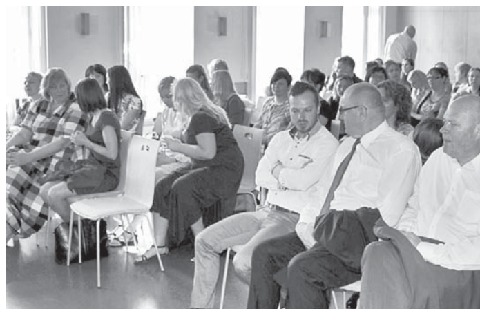
Konferencē pulcējas apmācību dalībnieki, pašvaldības un izglītības iestāžu pārstāvji.

Konferences turpinājumā programmā iesaistītie speciālisti – psihologi un pedagogi – stāstīja par programmas „STOP 4–7” vadīšanas pieredzi un rezultātiem, par programmas ieviešanu citos Latvijas reģionos, kā arī dalījās ar treneru apmācību pieredzi. Pasākuma ietvaros tika organizētas darba grupas, kurās piedalījās un viedok-