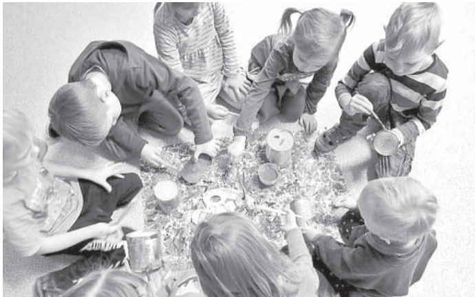
Izlietotās konservu kārbas iespējams pārvērst košos mūzikas instrumentos un dekoros.