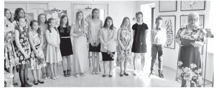
Mūzikas un mākslas skolas absolventi.

25. maijā notika ceturtais Ikšķiles Mūzikas un mākslas skolas audzēkņu izlaidums. Šogad mācību iestādi absolvēja vienpadsmit programmas „Māksla” audzēkņi un seši programmas „Mūzika” audzēkņi.