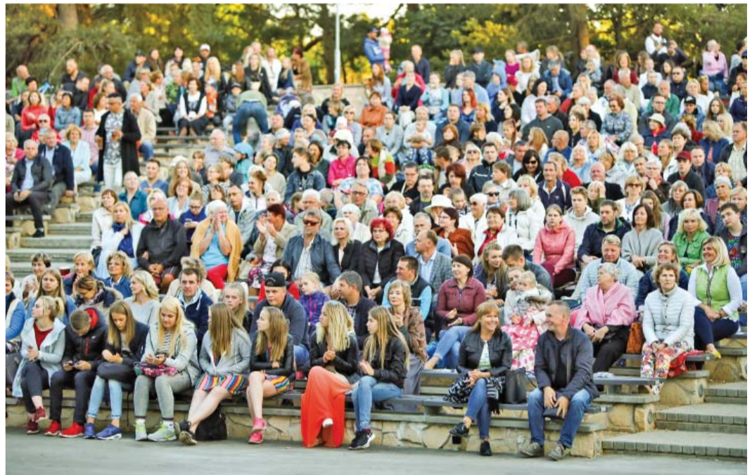
Ikšķiles estrāde – skatītāju piepildīta.

toriem un dalībniekiem. Pasākums, kas notika Tinūžu muižas pagalmā pie kuplā ozola, simboliski sasauca ar Latvijas simtgadi un ieskan-dināja XXVI Vispārējos latviešu dziesmu un XVI Deju svētkus.