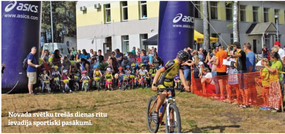
Novada svētku trešās dienas rītu ievadīja sportiski pasākumi.