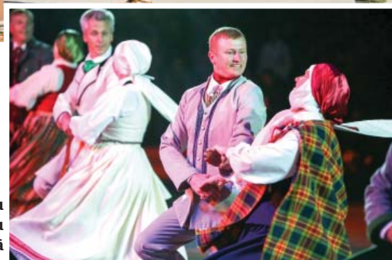
Pašmāju amatierkolektīvu sniegums – augstā līmenī.