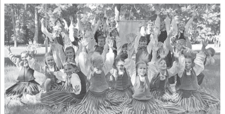
Ikšķiles vidusskolas audzēkņi Daugavpilī.

26. maijā vairāk nekā 500 Latvijas skolu dejotāju kopā ar saviem vadītājiem un skolotājiem pulcējās Daugavpilī uz bērnu tautas deju festivālu „Latvju bērni danci veda”, tā turpinot deju tradīcijas, kas stiprina Dziesmu un deju svētku ilggadējo pastāvēšanu Latvijā.