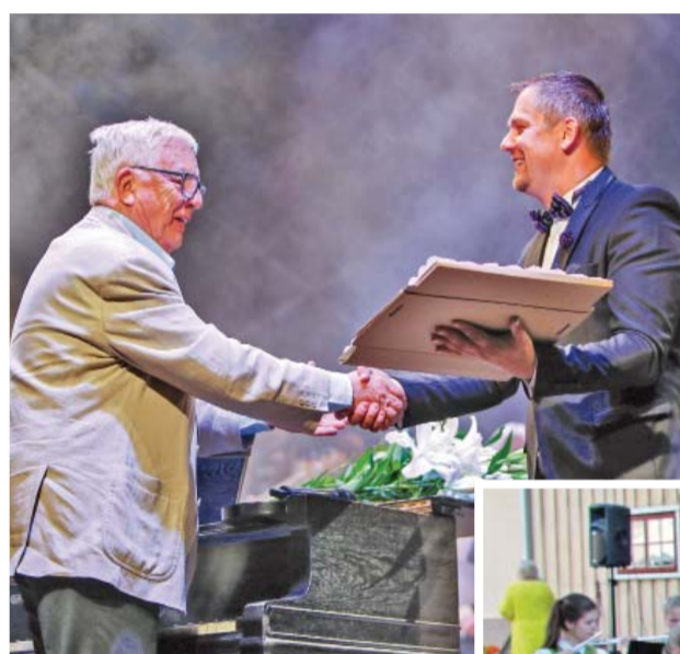
Domes priekšsēdētāja vietnieks Česlavs Batņa sveic svētku goda viesi – Maestro Raimondu Paulu.