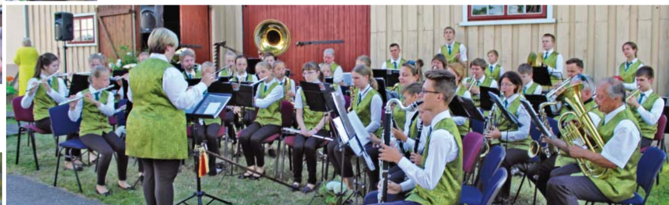
Tinūžos aizritēja pasākums „Sveika, Ikšķiles vasara!”.