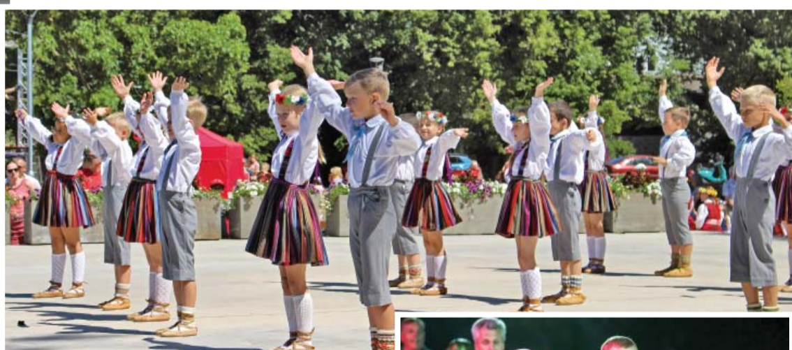
Bērnu deju kolektīva „Spolites” un jauniešu deju kolektīva „Spole” koncerts „Daudz laimes, Latvija!”.