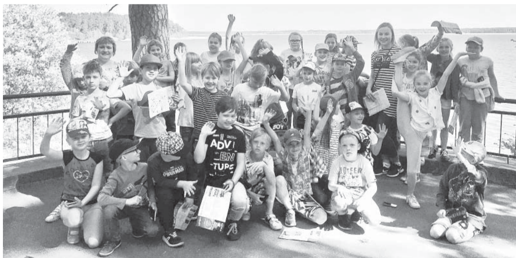
Apmeklējot Rīgas zooloģisko dārzu.

3. maijā četrdesmit 9. klašu skolēni devās iepazīt Rīgas Tehniskās universitātes darbību. Ekskursijas laikā jaunieši ciemojās RTU laboratorijas mājā.