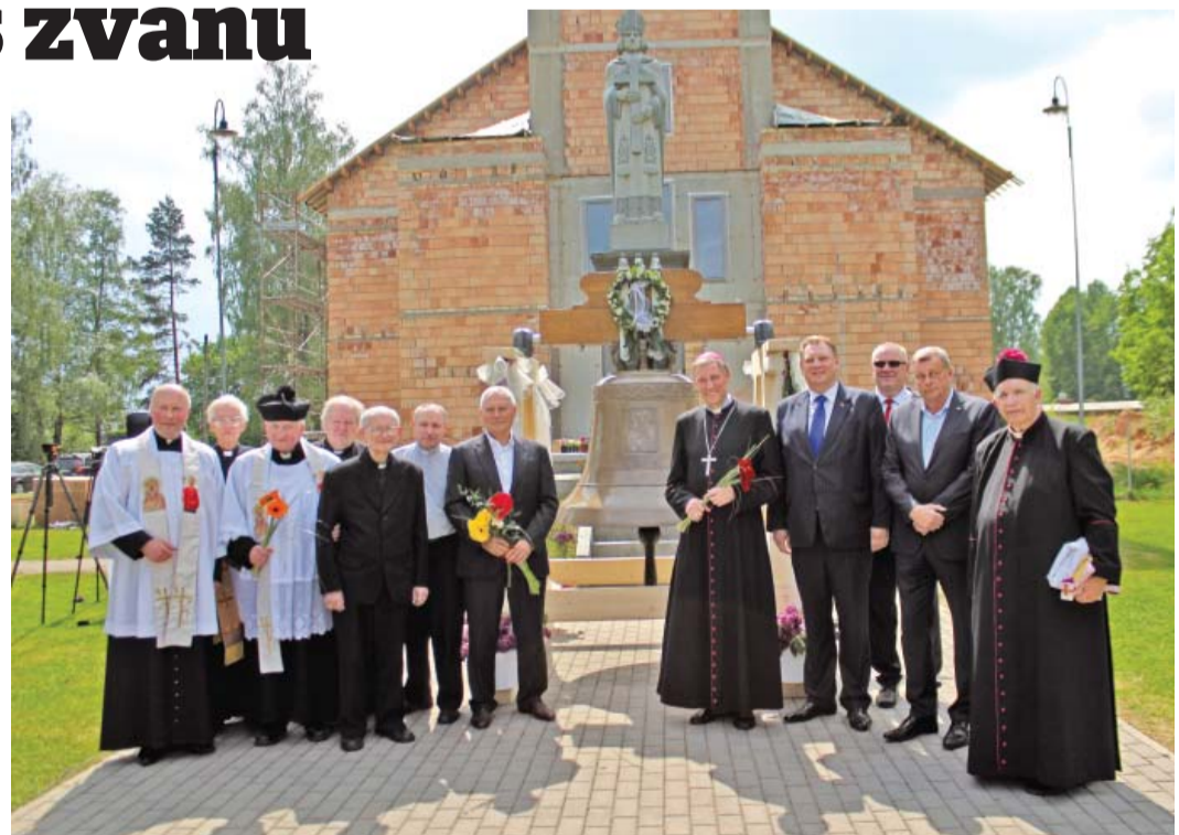
Pēc svinīgās zvānu iesvētišanas.

„Ikšķile noteikti nebūtu tik atpazīstama, ja nebūtu Svētā Meinarda. Kristietība Latvijā tika sludināta no Ikšķiles. Mēs, ikšķilieši, un Ikšķiles novada iedzīvotāji varam tikai lepoties ar