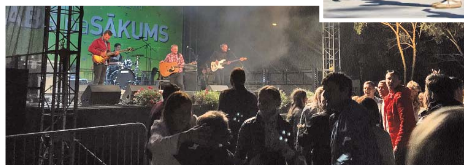
Otrās dienas vakarā notika koncertballe ar Latvijā pazīstamu mūziķu piedalīšanos.