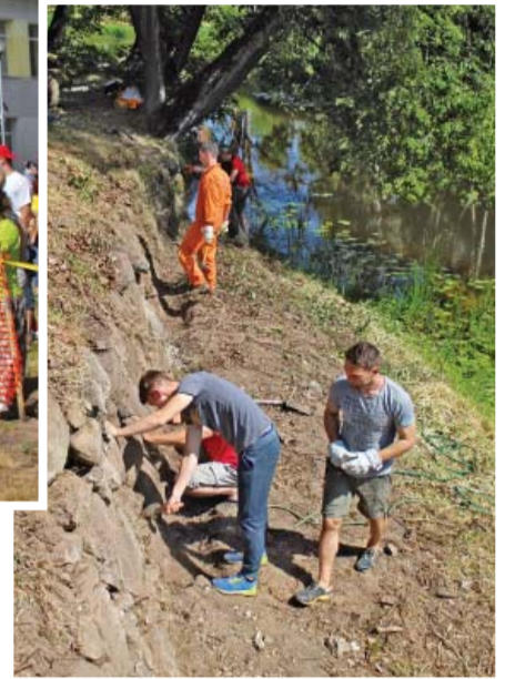
Tradicionālās būvniecības meistardarbnīca „Pašu spēkiem”.