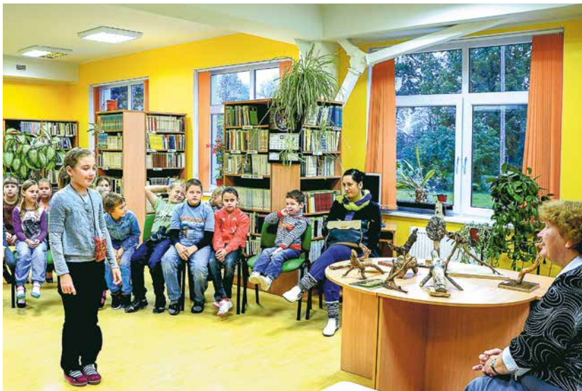
Lielvārdes vidusskolas skolēni interesējas par sakārnīšiem.

Pēc skolu aicinājuma mūsu seniori tiekas ar jauno paaudzi.