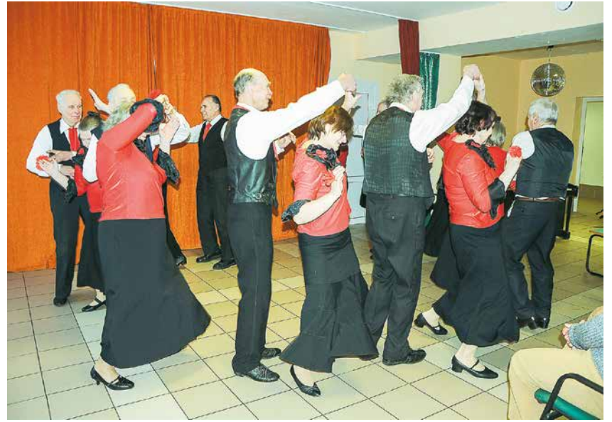
▲ Dejojam „Spāņu deju” Sķriveru pansionātā.

Esam cimojušies kristiešu draudzes „Zilais Krusts” Lēdmanes mītnē un pateicībā par viesmīlīgo uzņemšanu un viru ansambļa „Dzīvot vērts” sniegumu dāvājuši vīriem gan pašgatavotus konservus, gan pašādītu zēku pārus.