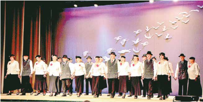
▲ Lielvārdes Pensionāru biedrības Eiropas tautu deju senioru ansamblis „Sidraboti gadi”.