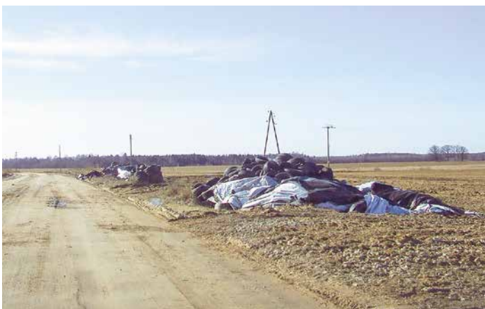
Nolietoto riepu krāvumi Lēdmanes pagasta ceļā uz Jumpravu.

Februāra beigās un marta sākumā Kaibalas iedzīvotāju satraukums par iespējamo lietoto riepu pārstādes ražotnes atvēršanu vecajā kolhoza „Lāčplēsis” kartupeļu pagrabā izraisījis diskusijas un atbalsi arī pārējā novada sabiedrībā, pašvaldībā un pat Latvijas televīzijas raidījumos.