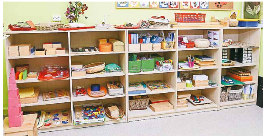
Valodas materiāli.