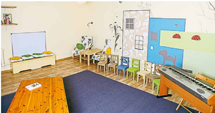
Mūzikas un mākslas terapijas telpa.

„Mārīte ABC” atrodas Lielvārdē, Raiņa ielā 5, „Māras apietiekas” telpās. Kontakttelefons: 29293268, e-pasts: mabces@gmail.com . ❖