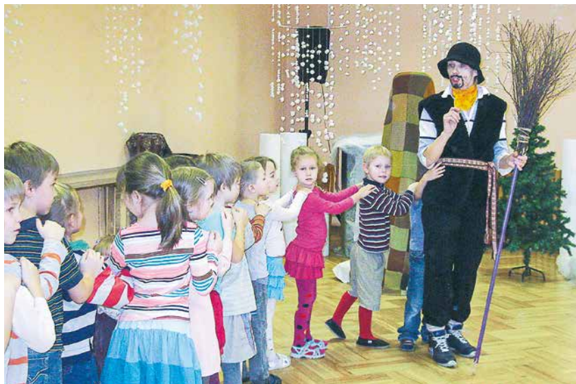
Metenis kopā ar bērniem dzen projām ziemu.

Ir sācies jauns gads, jaunas pārmaiņas un notikumi seko cits citam, bet Jumpravas pagasta bērnudārzā „Zvaniņš” turpina saglabāt tradīcijas, ievēro un atzīmē gadskārtu svētkus, kā arī ievērojamus notikumus.