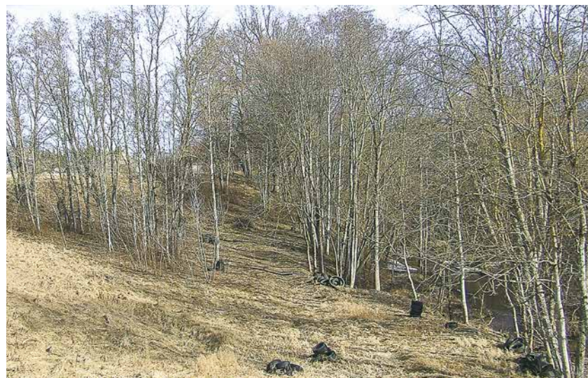
Izlietotās riepas gravā pie Kaibaliņas upes.

Tāpat gribu atspēkot nepatiesos apgalvojumus par SIA „Lāčplēša grauds” – mēs turpināsim lauksaimniecības kultūru audzēšanu un apstrādi. SIA „Lāčplēša grauds” darbiniekiem brīvā laikā, kad nav sezonas darbu, būs iespēja papildināt savus ienākumus, strādājot riepu pārstrādē.