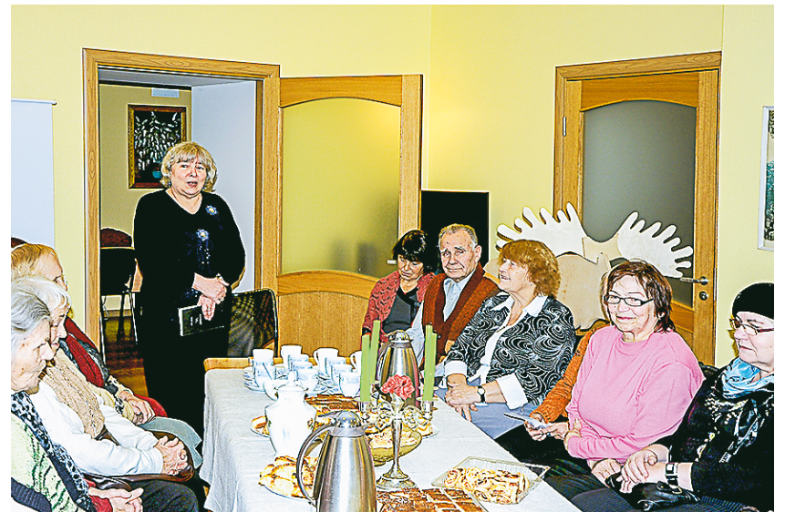
Senioru sanāksme 28.11.2013.