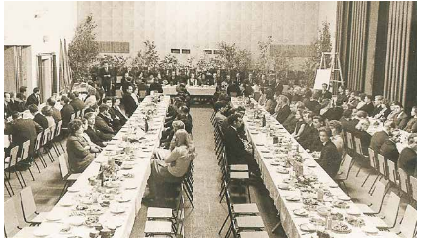
Pirmais saviesīgais pasākums atjaunotajā kultūras namā. Vēl nav balkona