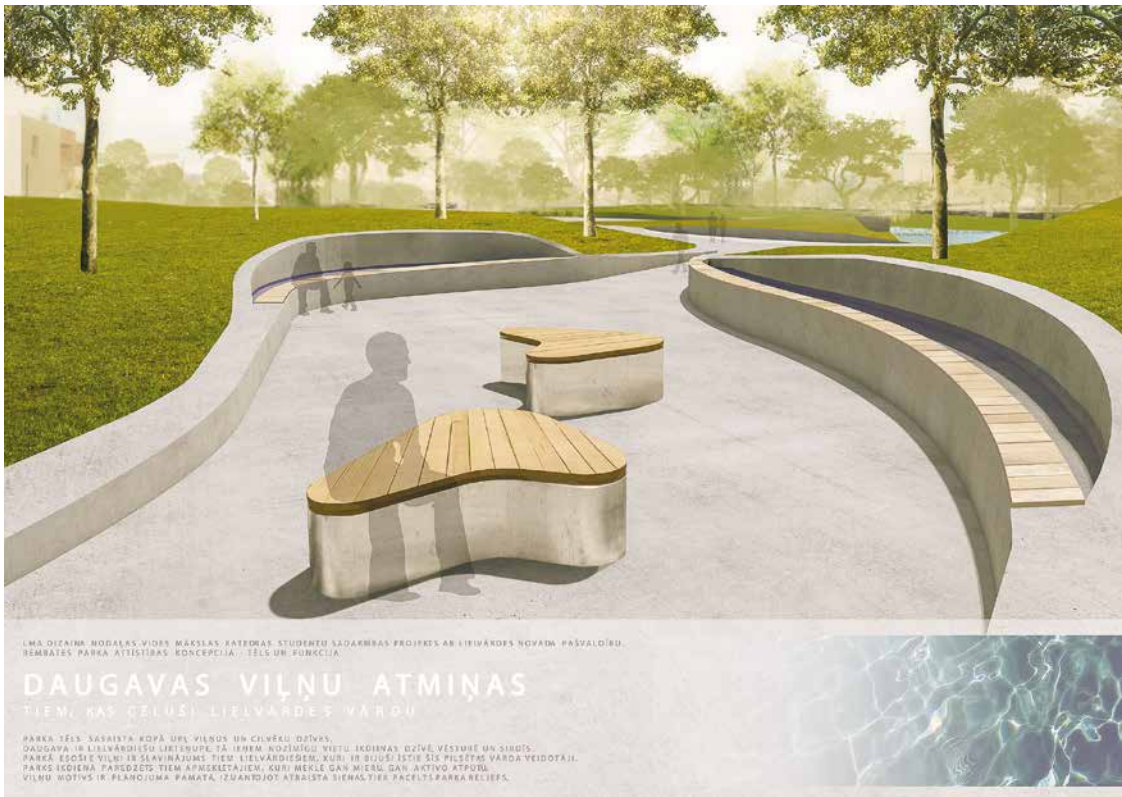
levas Petkunes Rembates parka redzējums „Daugavas viļņu atmiņas”.

19. februārī kultūras namā „Lielvārde” Latvijas Mākslas akadēmijas vides mākslas pedagogi un studenti prezentēja Rembates parka labiekārtošanas koncepcijas, kas tapušas sadarbībā ar Lielvārdes pašvaldību. Ekspozīcija „Rembates parka attīstības koncepcija – tēls un funkcija”, ko topošie dizaineri attīstījuši šajā studiju gadā, februāra sākumā bija aplūkojama lielākās Ziemeļvalstu mēbeļu un gaismas ķermeņu meses „Stockholm Furniture & Light Fair” jauno dizaineru izstādē „Greenhouse” (Stokholmā, Zviedrijā).