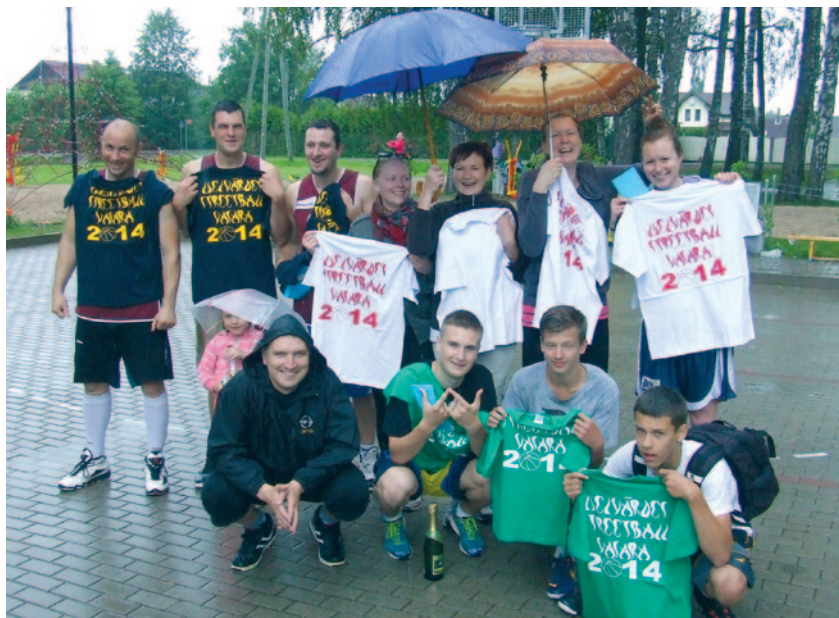
„Lielvārdes novada strītbola vasaras 2014” 2. posma uzvarētāji.