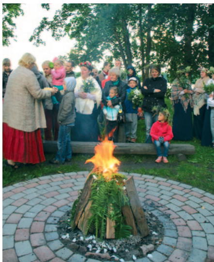
Visus saliedēja Jāņu ugunsroks un svētku cienasts.

Paldies lieliskajiem dziedātājiem un muzeja darbiniecēm par skaisto svētku vakaru! ❀