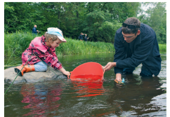
Foreļu mazuļu ielašana Ogres upē Lēdmanē.