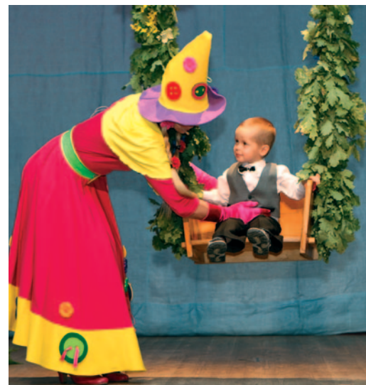
Rūķu krustmāmiņa izšūpoja visus gaviļņiekus.