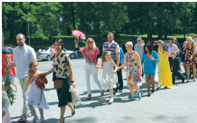
Uz svētkiem mazie gaviļņieki dodas ar vecākiem un krustvecākiem.

Jūnija pēdējā sestdienā kultūras namā Lielvārde notika novada bērnības svētki. Svētkos piedalījās 12 novada ģimenes. Tos kuplināja Čučumuižas rūķi un viņu krustmāmiņa.