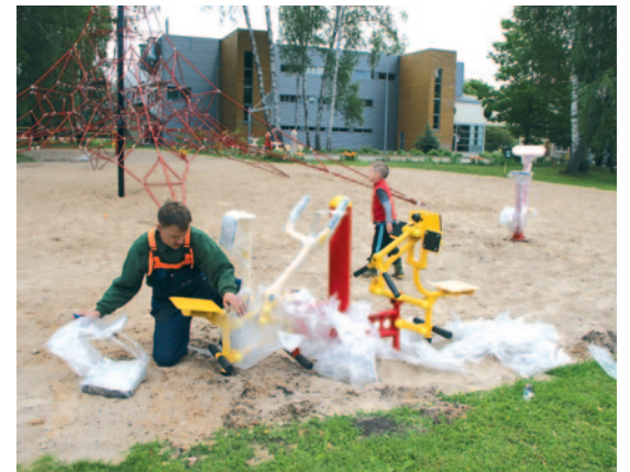
Jaunajā aktīvās atpūtas laukumā tiek uzstādīts aprīkojums.