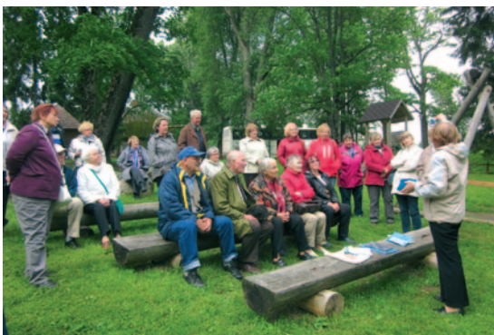
Rakstnieka Vika pasaku parkā.

Tālāk ceļš veda gar Kocēnu pagasta sakoptajiem tīrumiem un Vidzemes krāšņajām viensētām. Kā pedējais pieturas punkts bija krodziņa „Mazais Ansis” komplekss, kur mūs gaidīja veselīga dzīves veida atbalstītāja omu-