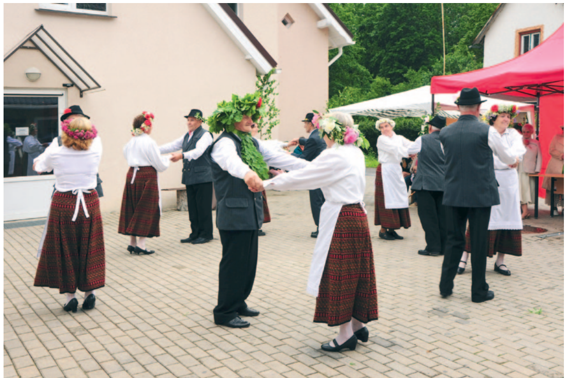
„Sidrabotie gadi” viesus priecēja ar raitu soli valšu ritmos.