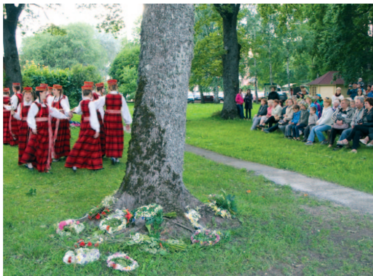
Saulgrieži Lielvārdes parkā.