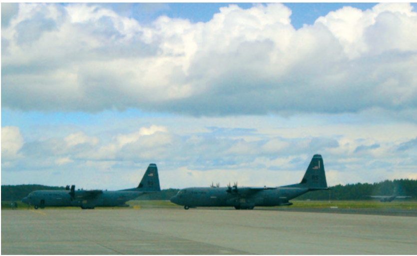
Lielvārdes lidlaukā nolaižas trešā ASV transporta lidmašīna „C-130”.

Pasākumā piedalījās arī NATO Apvienoto spēku pavēlniecības Brunsumā koordinācijas grupa, kas ieradusies Latvijā novērot mācības „Saber Strike 2014”. Tās pārstāvjai atzinīgi novērtēja Lielvārdes lidlauka attīstību un iespēju apmainīties ar informāciju, viedokļiem un plānot tālāku sadarbību. ❖