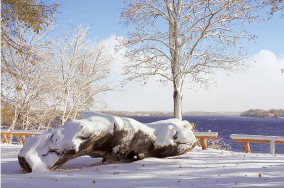
Daugava pie Lielvārdes ir viena no ainaviskākajām vietām visā jaunajā tūrisma maršrutā, kas tapis tūrisma un vides izglītības projekta "Lejasdaugavas novadu iedzīvotāju iesaiste velo un ūdenstūrisma maršrutu par godu Latvijas simtgadei izstrādē, kā arī vides izglītošanā" ietvaros.

un zināšanas, ir tādi, kuri sagaida emocijas un veselu izrādi, un ir viesi, kuri vēlas no sirds vienkārši parunāties par dzīvi. Visas šīs vēlmes ir jāpiepilda, jo cilvēki no muzeja sev līdz aiznes sajūtas – cik interesants ir bijis stāstījums vai saruna, cik veiksmīgi atrasts kontakts ar cilvēkiem, cik ļoti viņiem ir patikusi gida piedāvātā interpretācija. Ir milzīgs gandarījums un, manuprāt, augstākais darba atalgojums, ja pa durvīm ienācis svešinieks pēc kopīgas un interesantas sarunas dāvā savu apskāvienu un muzeju atstāj kā tuvs un ļoti pazīstams draugs. To dēvēju par brīnumu – brīdi, kad saskaras divu cilvēku dvēseles."