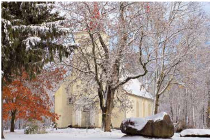
Kā uzskata vides gidu kursus apmeklējušie lielvārdieši, viens no mūsu novada galvenajiem intereses objektiem ir Lielvārdes novada baznīcas.

un zināšanas, ir tādi, kuri sagaida emocijas un veselu izrādi, un ir viesi, kuri vēlas no sirds vienkārši parunāties par dzīvi. Visas šīs vēlmes ir jāpiepilda, jo cilvēki no muzeja sev līdz aiznes sajūtas – cik interesants ir bijis stāstījums vai saruna, cik veiksmīgi atrasts kontakts ar cilvēkiem, cik ļoti viņiem ir patikusi gida piedāvātā interpretācija. Ir milzīgs gandarījums un, manuprāt, augstākais darba atalgojums, ja pa durvīm ienācis svešinieks pēc kopīgas un interesantas sarunas dāvā savu apskāvienu un muzeju atstāj kā tuvs un ļoti pazīstams draugs. To dēvēju par brīnumu – brīdi, kad saskaras divu cilvēku dvēseles."