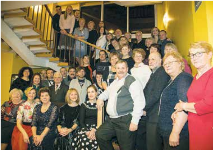
Kuplā Lielvārdes Tautas teātra saime svin teātra 145 gadu jubileju.