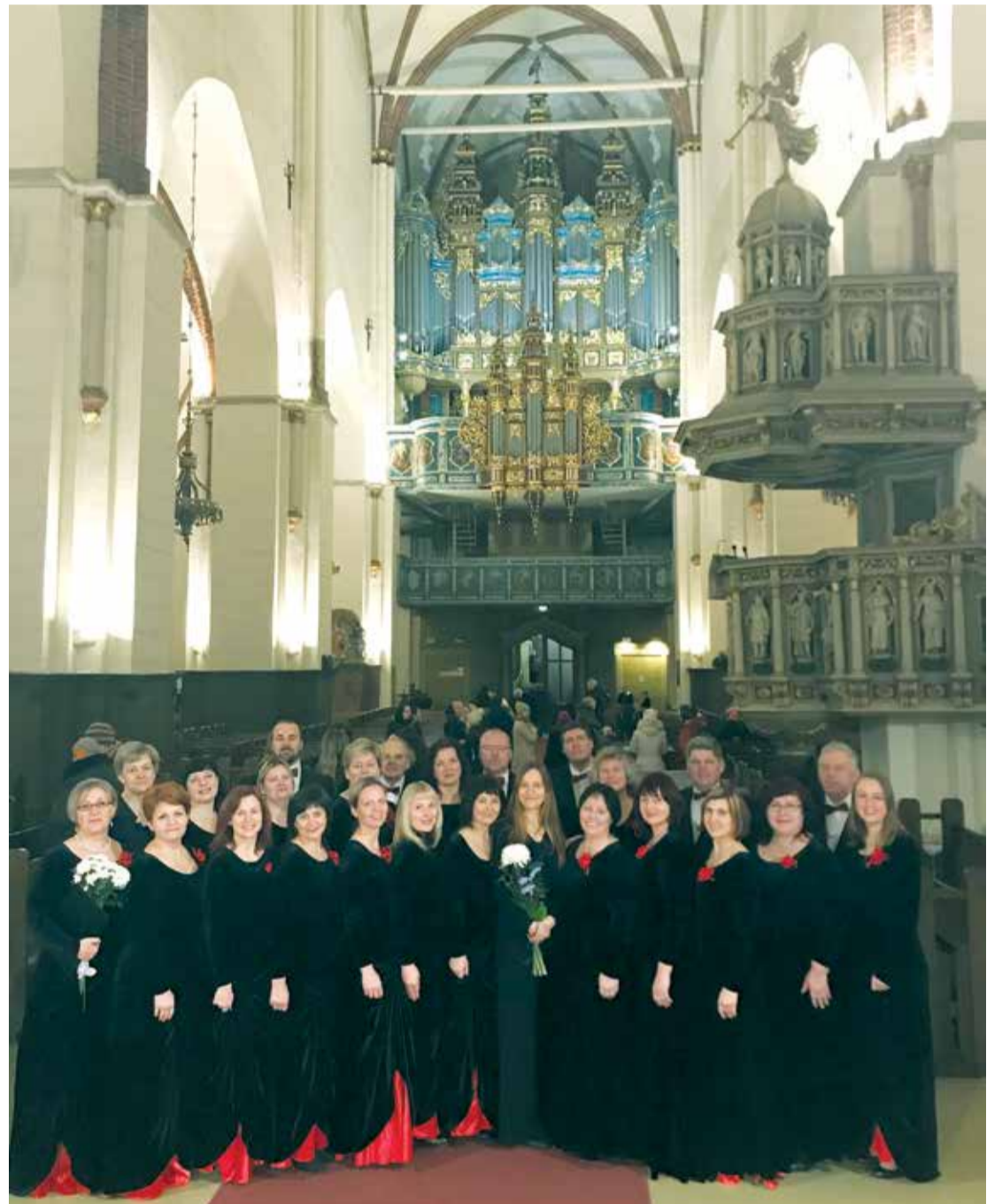
Koris Doma baznīcā.