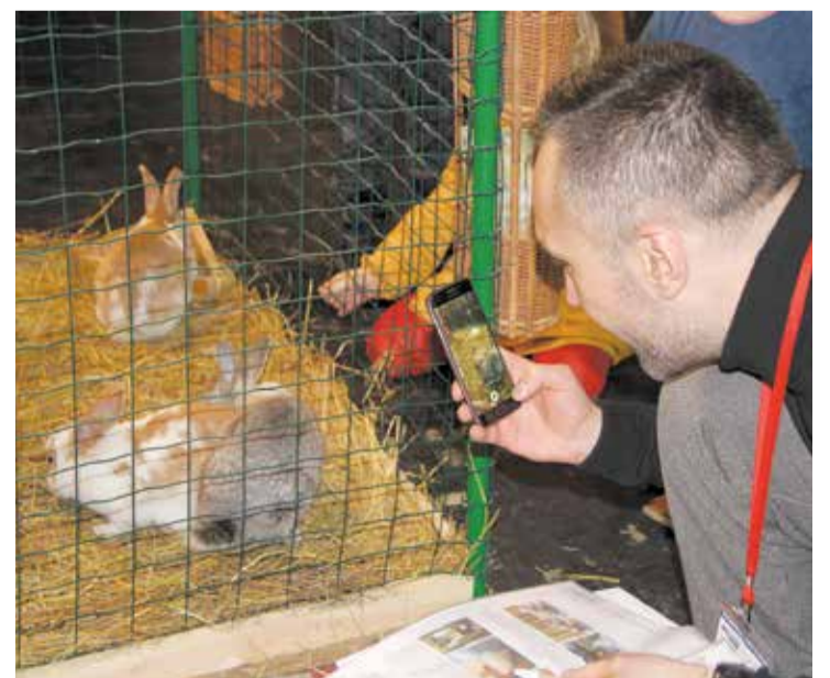
Šogad gan lielu, gan mazu apmeklētāju uzmanību izpelnījās "Trušu karalistes" pūkaiņi.

Irēna Arāja, Andreja Pumpura Lielvārdes muzeja galvenā speciāliste