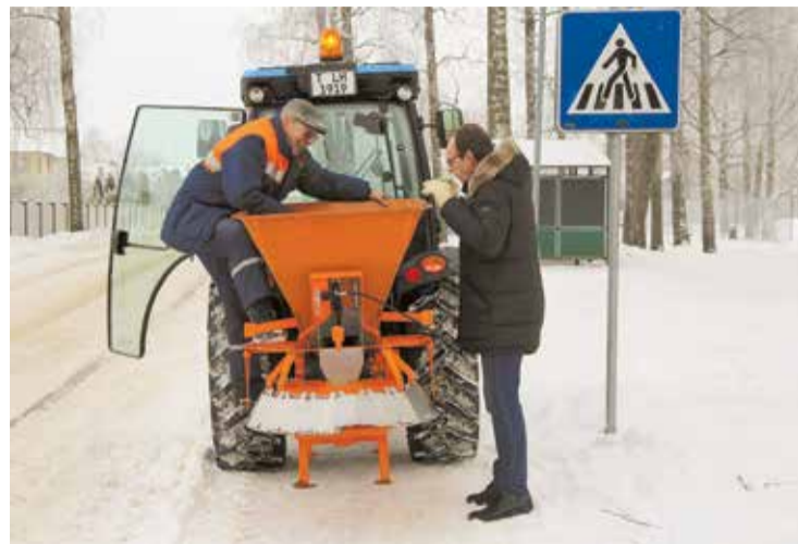
“Lielvārdes Remtes” darbinieki izmēģina jauno kaisītāju.