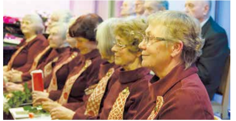
Senioru koris “Kamene” 25 gadu jubilejas koncertā.