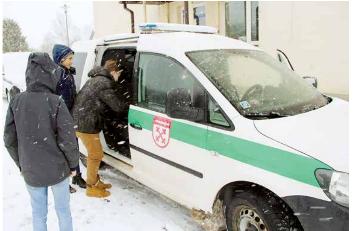
Pašvaldības policijas "ēnām" bija iespēja izpētīt policijas auto.

"Ēnu diena" Jumpravas kultūras namā noritēja ļoti nepiespiestā gaisotnē. Izzināt un pavērot kultūras pasākumu organizatora ikdienu bija pieteikušās 3 "ēnas". Dienas gaitā ēnotājiem bija iespēja iepazīties ar Jumpravas kultūras nama telpām un tā vēsturi, pasākumu plānu, kā arī ar profesijas galvenajiem darba pienākumiem. Tika praktizētas iemaņas arī pasākuma scenārija veidošanā.