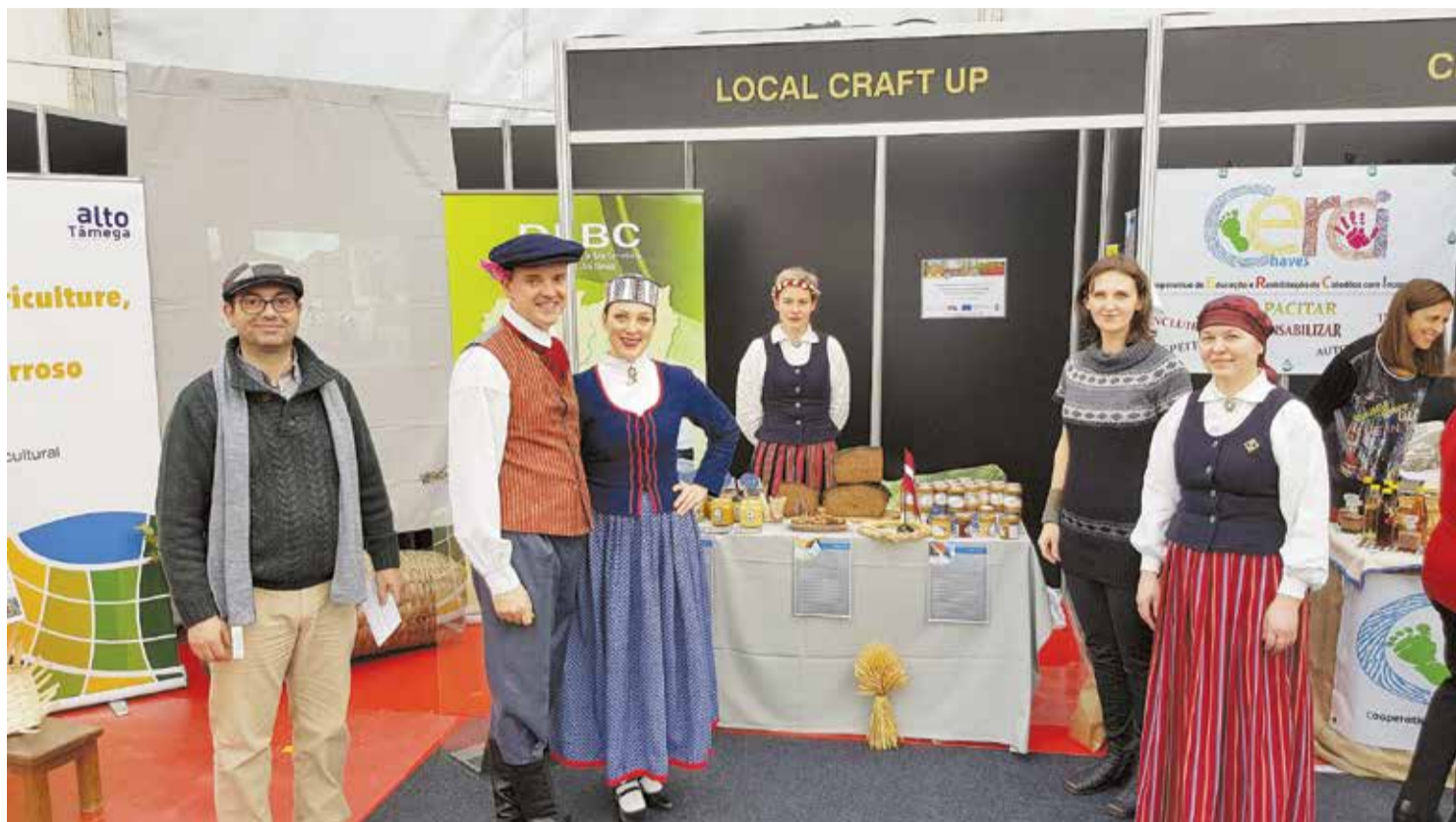
Novada uzņēmēju stends gardēžu festivālā Portugālē "Sabores de Chaves".

Portugāļi ir ārkārtīgi laipni un viesmīlīgi un nevilcinājās mūs aicināt ciemos uz savām saimniecībām un uzņēmumiem. Tā kā visi trīs delegācijā iesaistītie ražo-