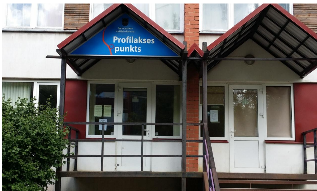
Profilakses punkts, Ogre, Mālkalnes pr.30