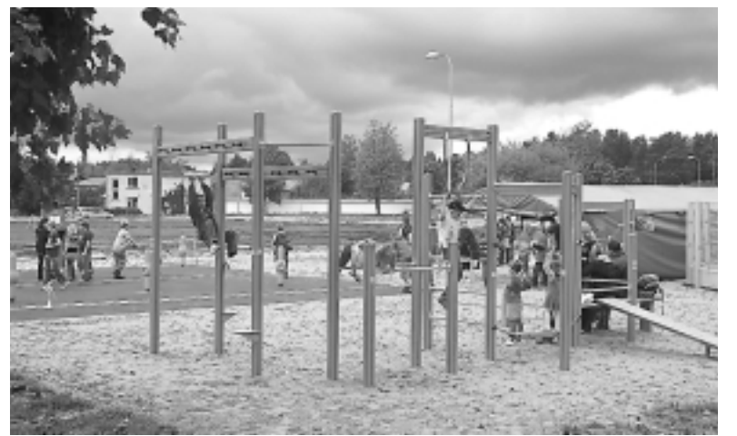
Bērni un jaunieši labprāt pavada brīvo laiku jaunajā rotaļlaukumā.

"Centrā ar jauniešiem esam runājuši par to, ka no oktobra viņi pēc savas iniciatīvas varētu seīt dežurēt arī sestdienās no pl. 15 līdz pl. 18," saka centra vadītāja, bet tam piekrituši