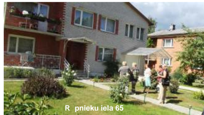
Rāpnieku iela 65