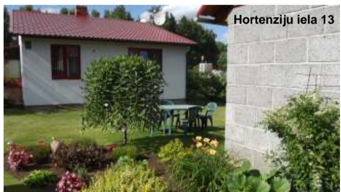
Hortenziju iela 13