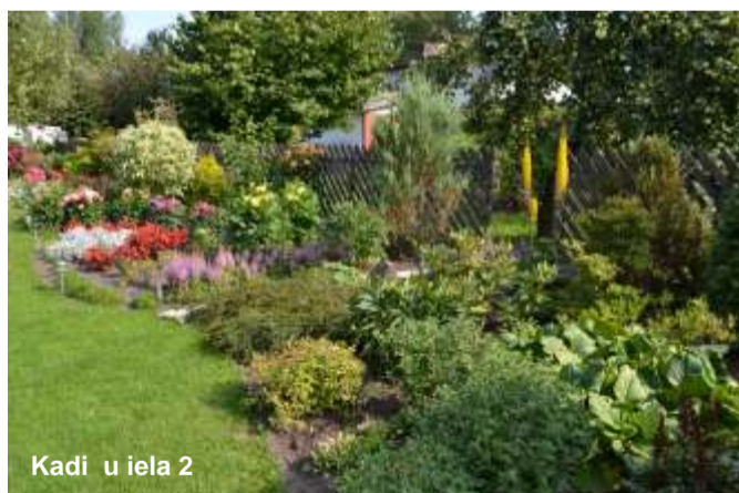
Kadiķu iela 2