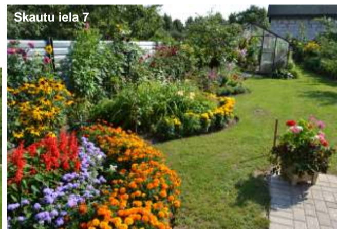
Skautu iela 7