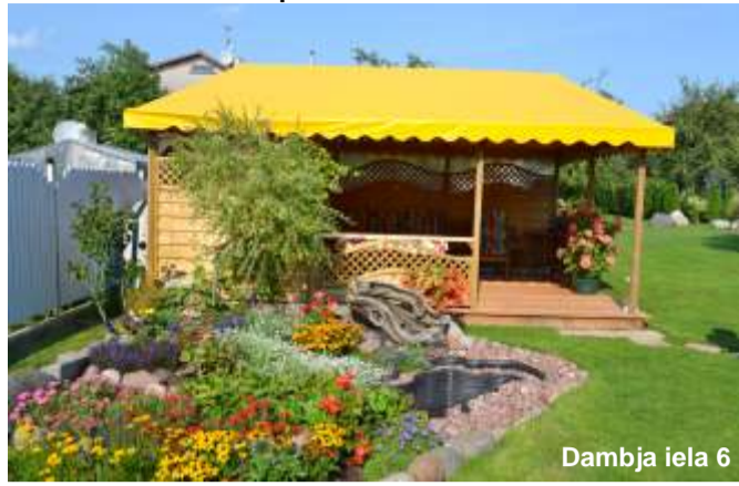
Dambja iela 6

Ar šogad mums apkārt netrūkst skaistu, sakoptu un mīlētu dārzu