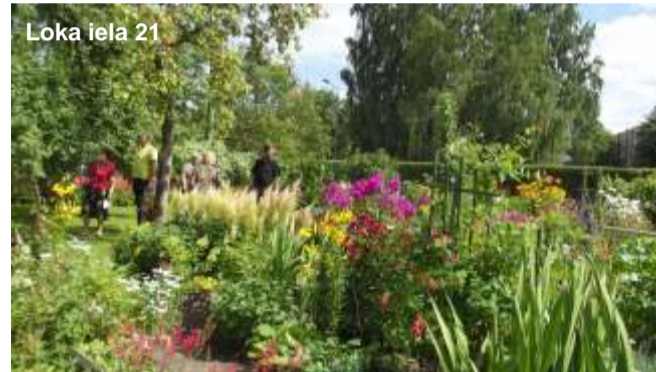
Loka iela 21