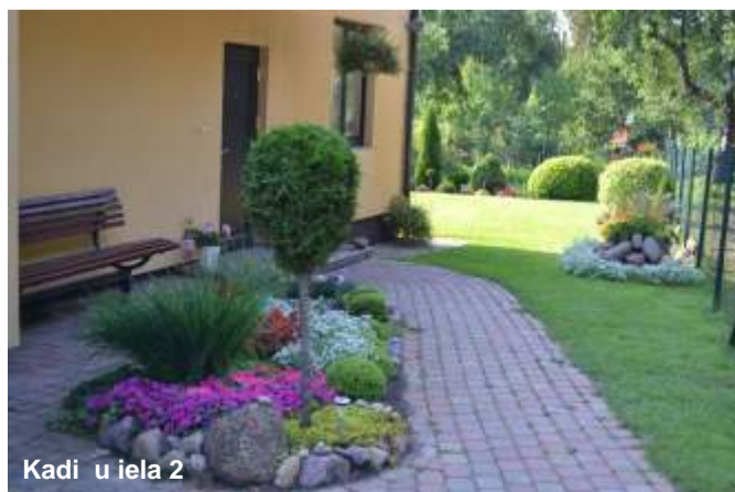
Kadiķu iela 2