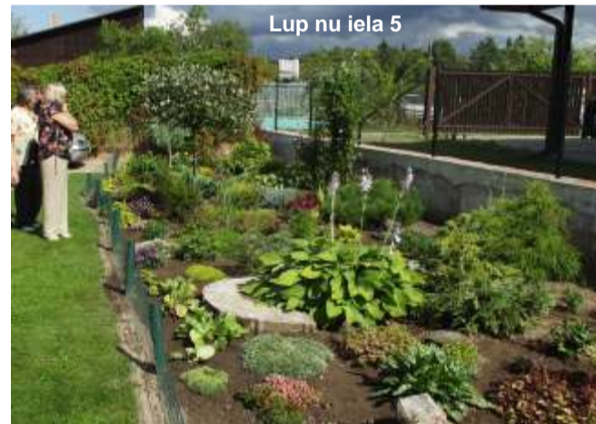
Lupu iela 5