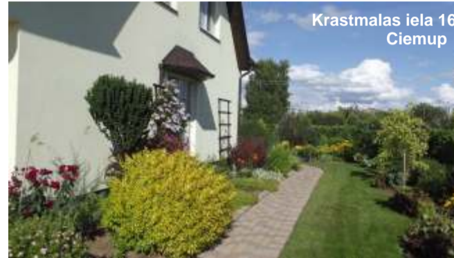
Krastmalas iela 16 Ciemup