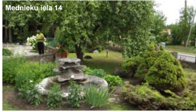
Mednieku iela 14