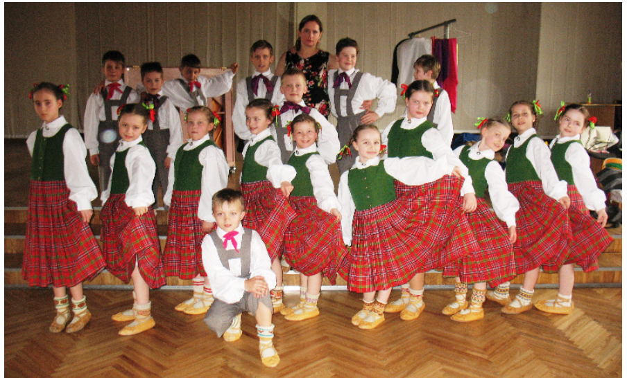
“Zeltupītes” 1.-3.klašu skolēnu grupa šovasar Ogres kultūras centrā pirms skates