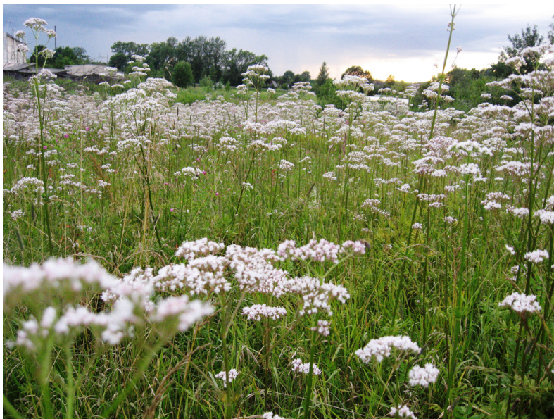
Par visdziedinošāko Jāņu zāli tiek uzskatīts buldurjānis.