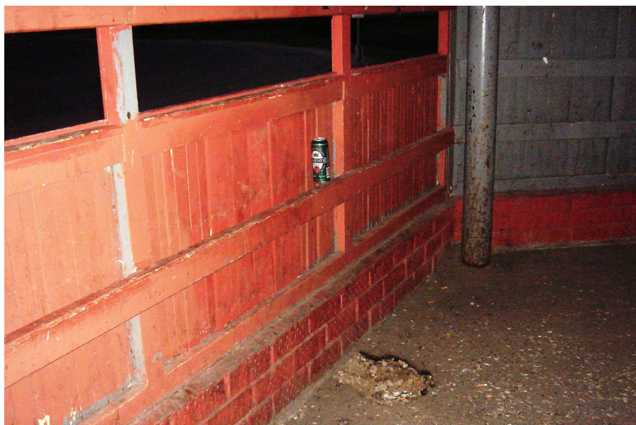
Tāda izskatījās jauniešu “kulturālas” sestdienas atpūtas vieta - Ķeipenes centra autopietaura š.g. 4. jūnijā - piemētāta, piegružota, nefīra. Jauniešiem laikam tā šķīta gana pievilcīga vieta sestdienas atpūtai - tusiņam.