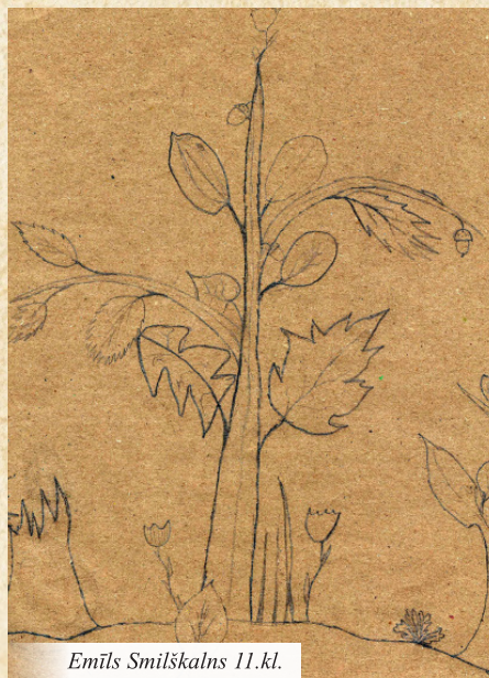
Emīls Smīlskalns 11.kl.