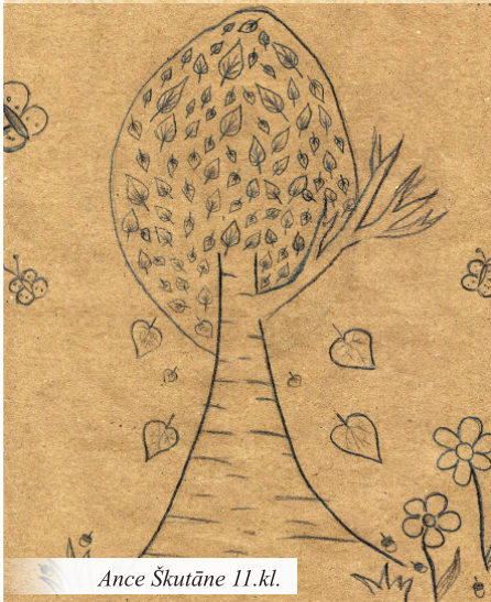
Ance Škutāne 11.kl.