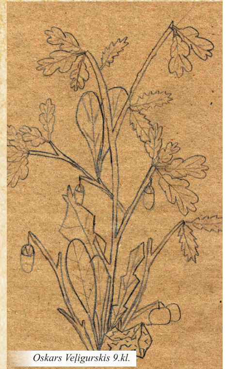
Oskars Veļģurskis 9.kl.