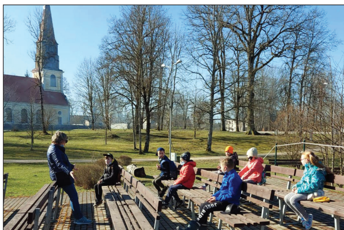
1. klases klātienas satikšanās estrādē