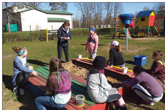
Dabas zinību nodarbība par iežiem