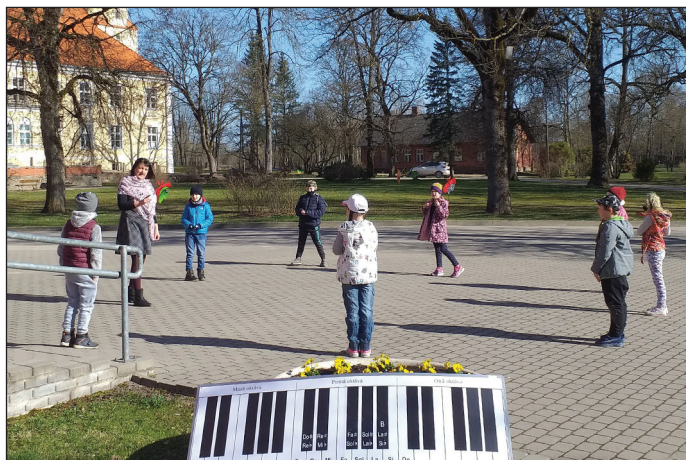
Āra nodarbība mūzikā