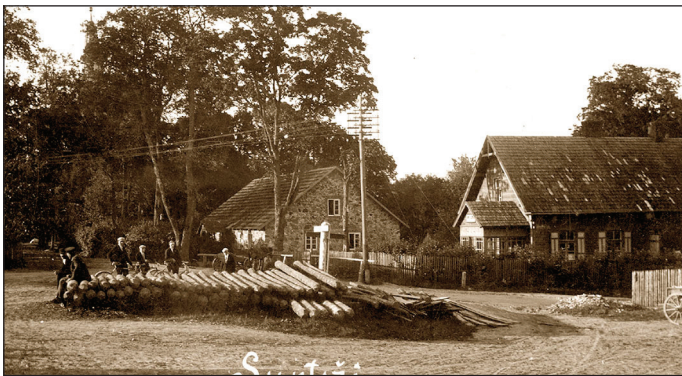
Suntažu centrs 20. gadsimta pirmajā pusē