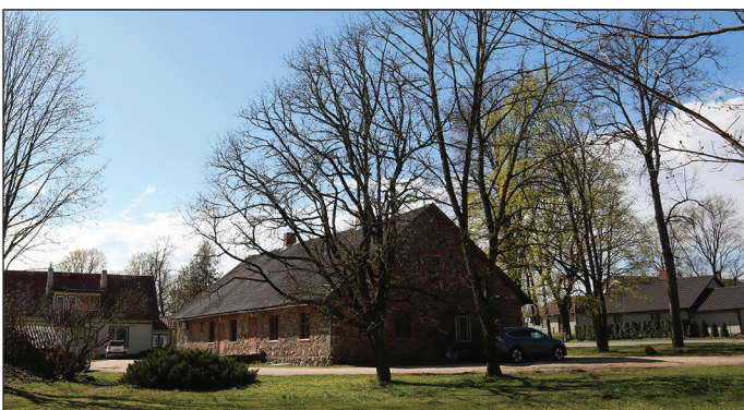
Bijušais pagasta nams