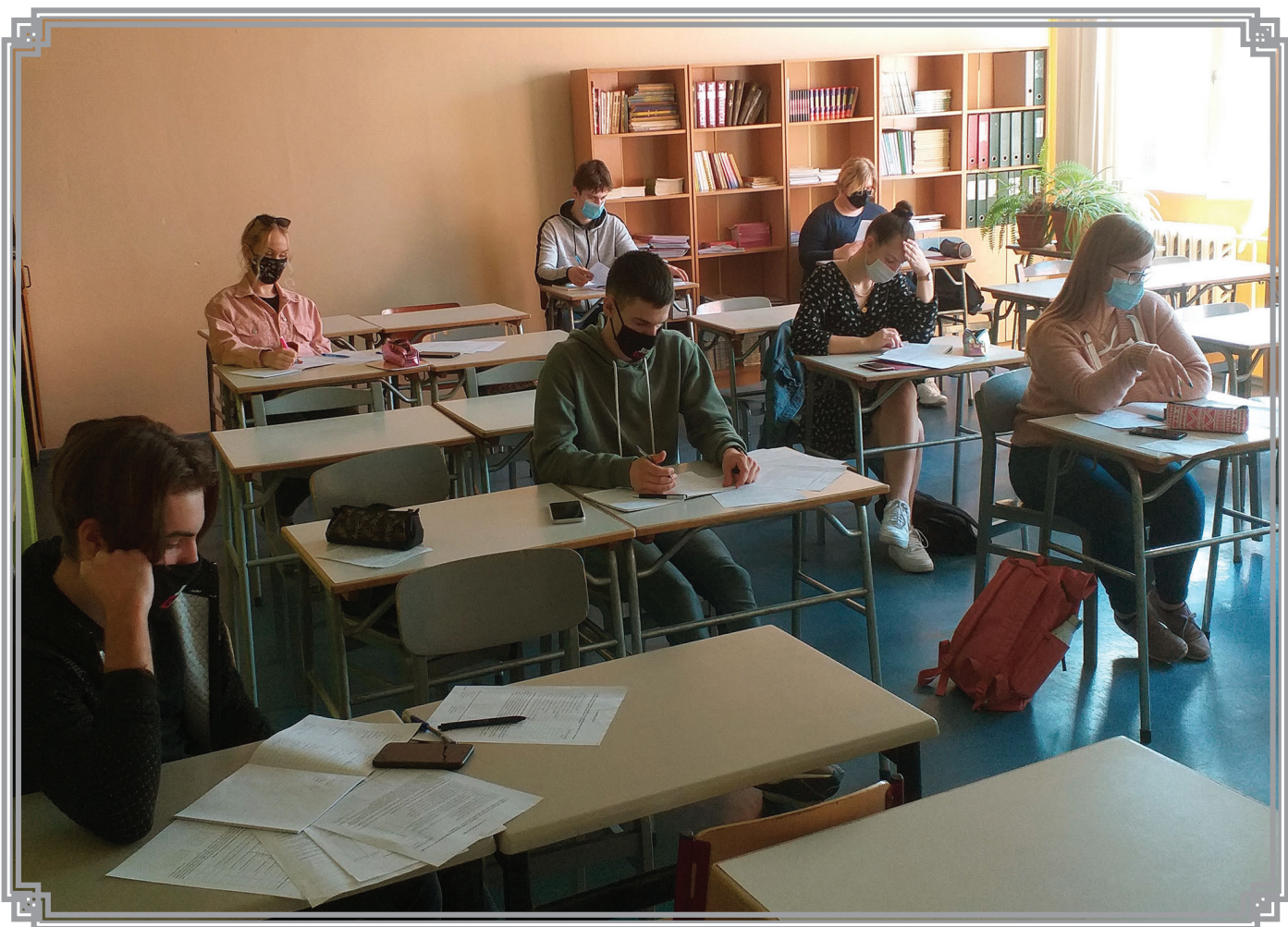
12. klase latviešu valodas konsultācijās