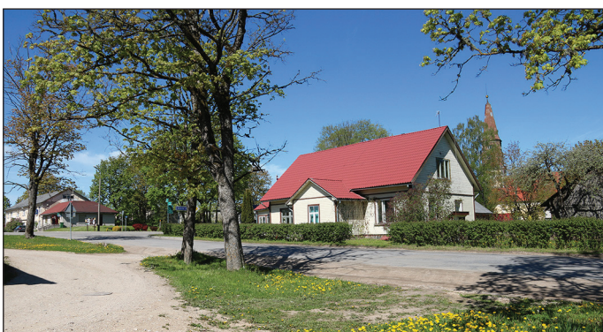
Suntažu centrs mūsdienās