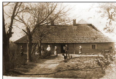
Veca dzīvojamā ēka Suntažos.