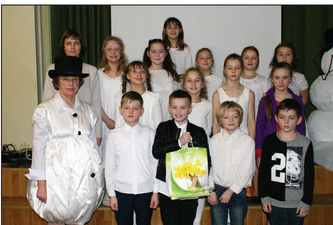
3. klasē lasa visi!