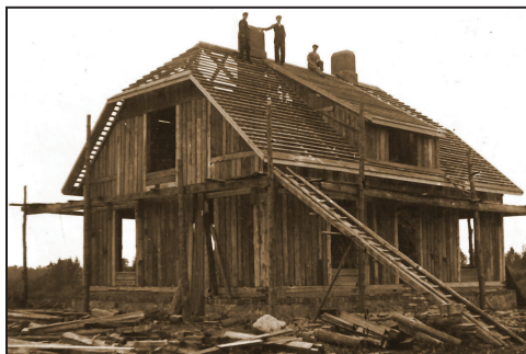
“Lakstīgalu” dzīvojamās mājas celtniecība.

20. gados jaunas ēkas būvēja arī vecsaimniecības, ja tās kara gados bija nopostītas vai vecā dzīvojamā ēka vairs nebija pietiekami ērta. Un Suntažu ainavā vietumis mijās vecās ēkas ar jaunajām, kaut gan jauno ēku bija vairāk.