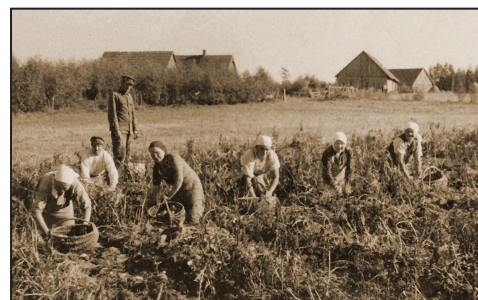
Kartupeļu rakšana jaunsaimniecībā “Vilkkalns”.