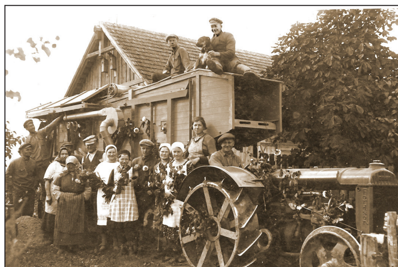
Kulšanas talka “Lakstīgalās”, ap 1935. gadu

piemērojoties konkrētiem gadījumiem un vietējiem apstākļiem” (Latvijas agrārā reforma, 1930, 663. lpp.).