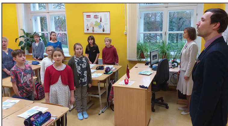
4. klase dzied himnu kopā ar direktoru