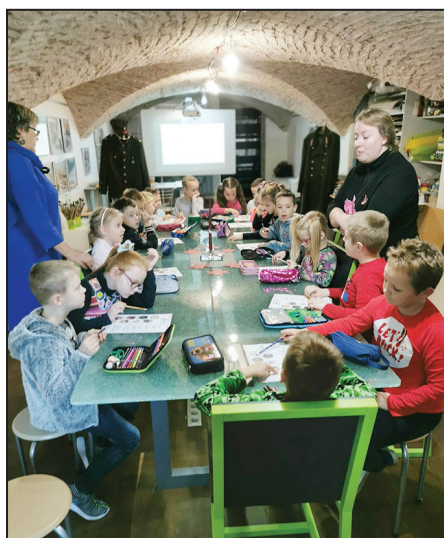
Ieskats vēstures notikumos