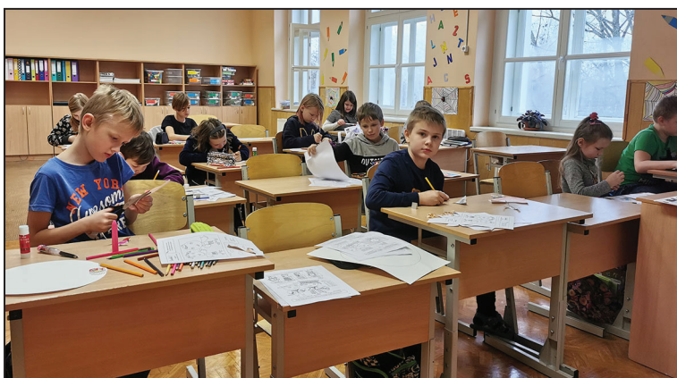
3. klase gatavo svētku dekorācijas