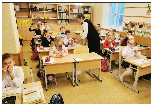
1. klases skolēni tiek cienāti ar svētku gardumiem