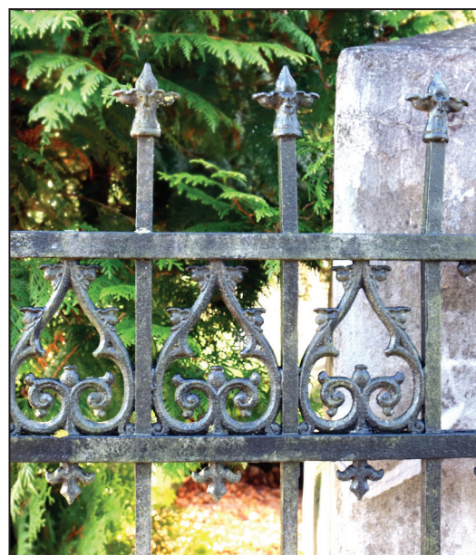
leejas vārtu fragments