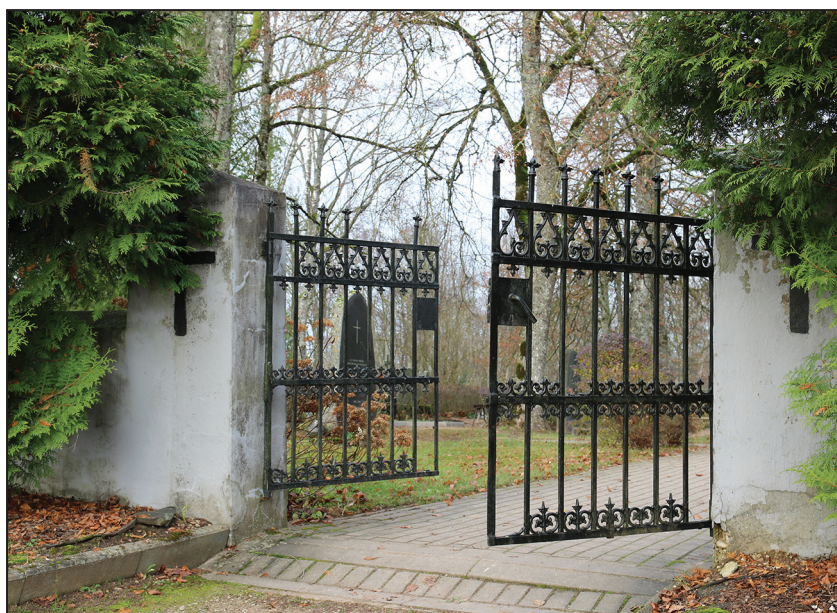
leejas vārti Suntažu kapos